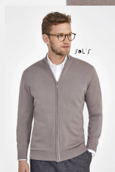
GORDON MEN 00548