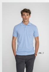
PRIME MEN 00571