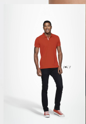
PORTLAND MEN 00574