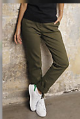
NEOBLU GUSTAVE WOMEN 03179