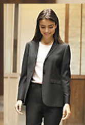
NEOBLU MARIUS WOMEN 03165