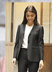
NEOBLU MARIUS WOMEN 03165