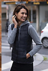
NEOBLU ARTHUR WOMEN 03173