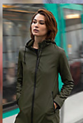
NEOBLU ANTOINE WOMEN 03175