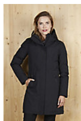
NEOBLU ALFI WOMEN 04005